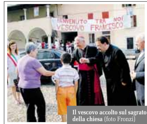
Il vescovo accolto sul sagrato della chiesa