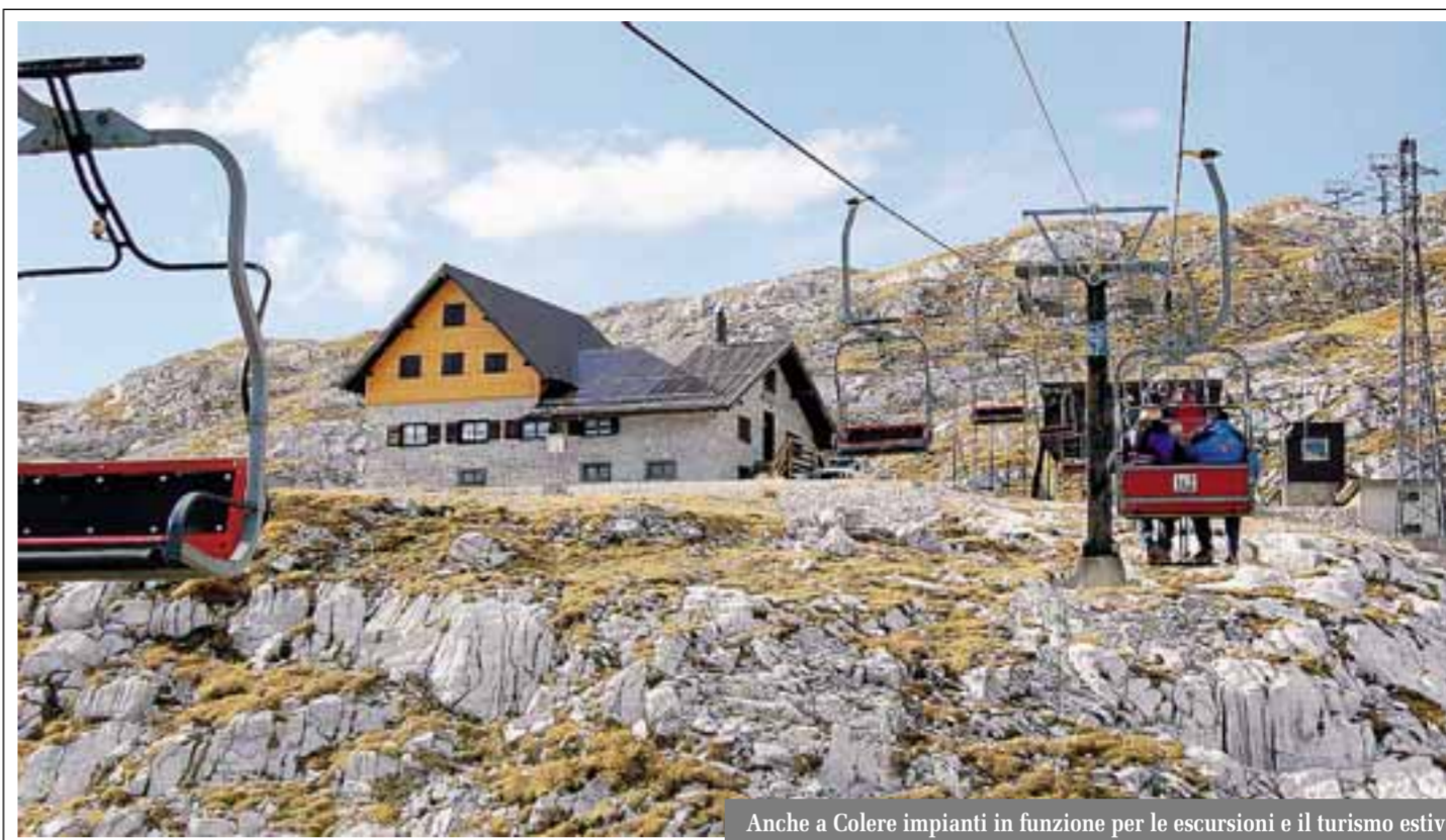
Anche a Colere impianti in funzione per le escursioni e il turismo estivo