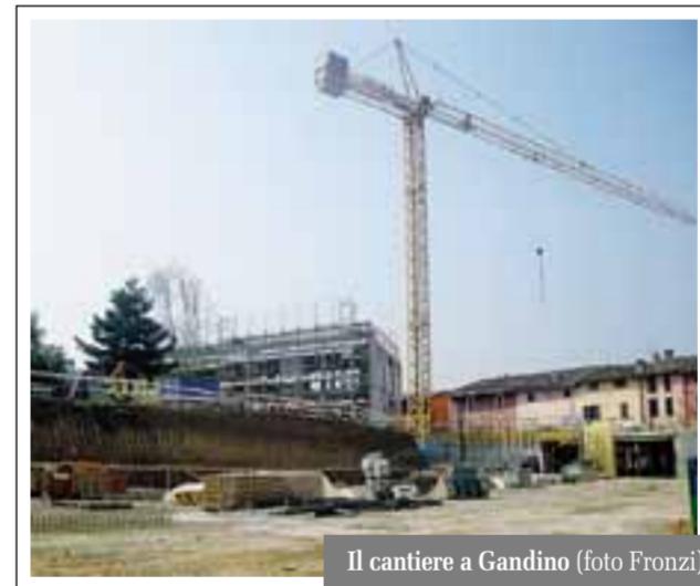
Il cantiere a Gandino

I lavori per il nuovo oratorio sono stati avviati già dallo scorso anno, dapprima con la demolizione del preesistente edificio e poi con opere di scavo e fondazione, particolarmente articolate visto che il progetto, realizzato dall'architetto Gualtiero Oberti, prevede anche la realizzazione di un parcheggio interrato sotto il campo di calcio in sintetico. Sono previsti una settantina di posti auto, grazie ad una specifica convenzione con il Comune. Il costo dei lavori, affidati alla ditta Poledri di Tescore Balneario, ammonta a circa 4 milioni di euro. L'edificio si articolerà in tre volumi principali su più livelli: a piano terra un grande spazio polivalente, al primo livello il bar, la sala pranzo, le cu-