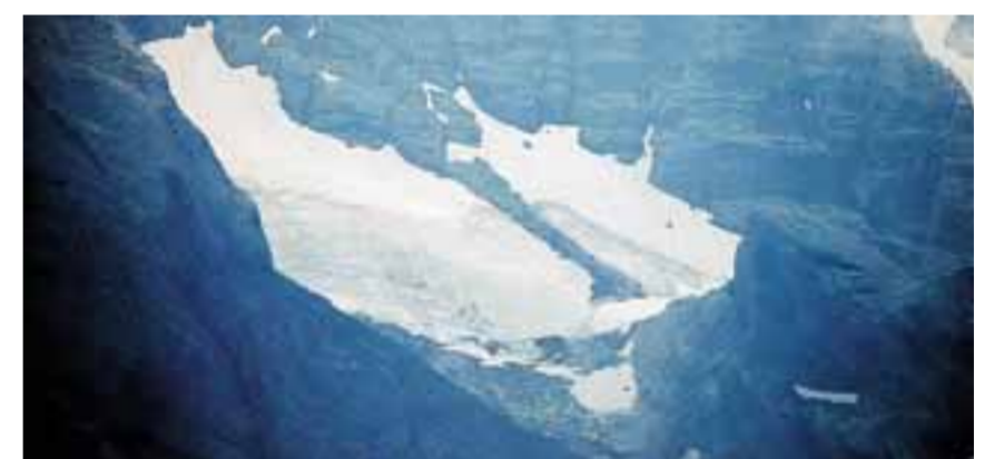
A sinistra, il ghiacciaio Lupo e il ghiacciaio Pizzo Scotes da Passo di Coca il 31 agosto 2009.