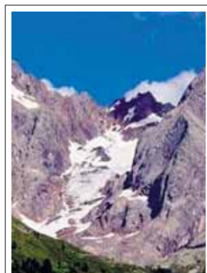
Il ghiacciaio Porola il 23 luglio 2008

Weekend all'insegna della sicurezza in montagna, quello che si è appena concluso. Ieri è stata la giornata dei suggerimenti sul campo, quella di «Sicuri sul sentiero e in ferrata», iniziativa che, giusto per restare in Bergamasca, i volontari del Soccorso alpino e del Cai hanno organizzato all'attacco della ferrata della Madonna in Val Brembilla. Appuntamento precedente, sabato, da un incontro in cui si è parlato di teoria e di numeri.