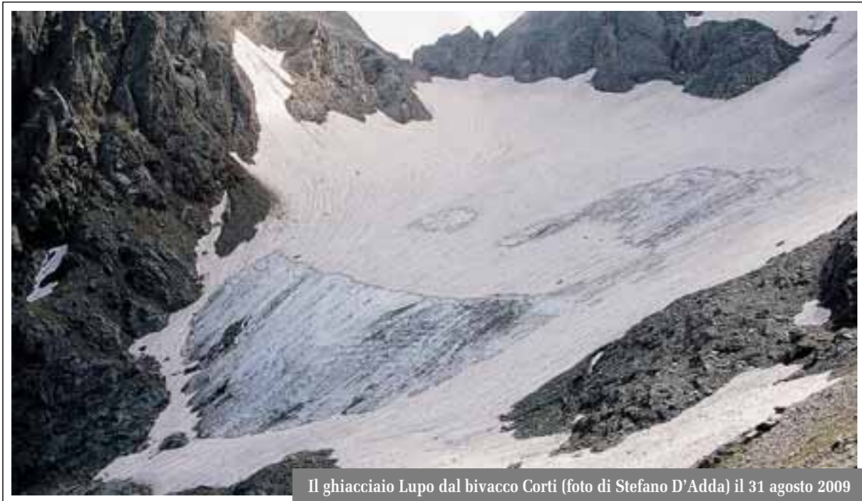
Il ghiacciaio Lupo dal bivacco Corti il 31 agosto 2009