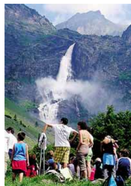
Turisti nelle valli bergamasche. Secondo il rapporto dell'Osservatorio provinciale, nell'ultimo decennio la presenza di visitatori sulle Orobie è calata dell'11%. Sulle nostre montagne il turismo è principalmente estivo, ma gli stranieri si concentrano in inverno

della nostra zona sono ridotti ad andare a prendere i turisti in auto allo scalo - dice -. Siamo comunque moderatamente soddisfatti per l'incremento registrato nel Sebino e in Valle Cavallina. Gli operatori turistici hanno fatto uno sforzo notevole, ma sono pochi».