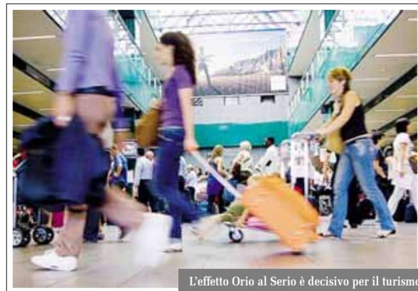
L'effetto Orio al Serio è decisivo per il turismo