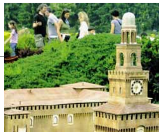
In alto a sinistra, la mappa del nuovo parco: accanto alla penisola, l'area con hotel e negozi. Qui sopra, i monumenti storici; sotto, un'immagine del village dell'architetto Di Pasquale