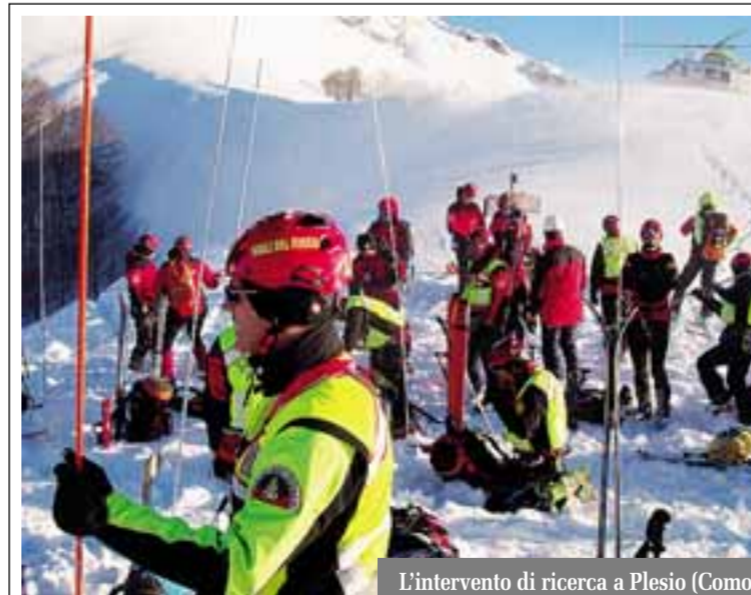
L'intervento di ricerca a Plesio (Como)

Proprio per evitare il ripetersi di tragedie spesso evitabili con comportamenti più attenti, il governo - su proposta del Dipartimento della Protezione civile - ha presentato un emendamento al decreto legge sulle emergenze in discussione al Senato: è previsto il carcere per chi, provocando una valanga, si rende responsabile della morte di altre persone e cinquemila euro di ammenda per chi scia fuori pista o compie escursioni in montagna quando i bollettini meteo-meteorologici indicano una situazione di reale pericolo. Il provvedimento ha già ricevuto il via libera dalla commissione Ambiente e sarà ora l'Aula del Senato a decidere se approvarlo o meno. Intanto, si contano i morti. Sei in totale, la metà in Veneto. Due li han-