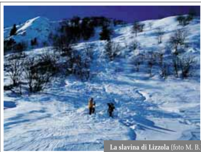
La slavina di Lizzola