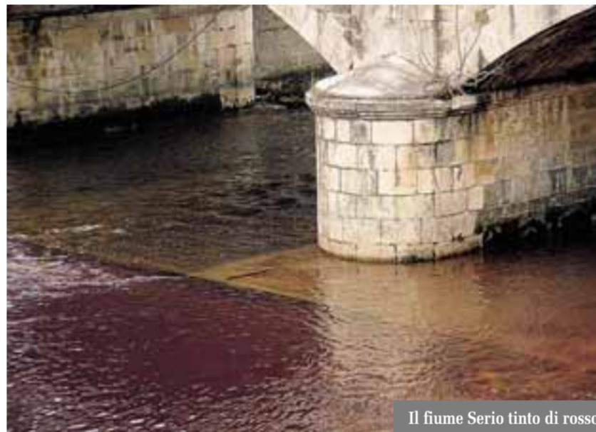
Il fiume Serio tinto di rosso