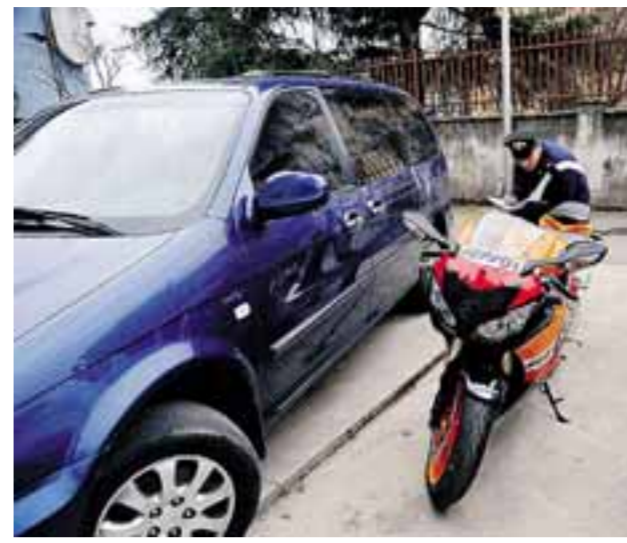
Sopra la Honda Cbr 1.000 rubata da un garage di Stezzano, recuperata dai carabinieri al termine di un rocambolesco inseguimento in paese e restituita al legittimo proprietario. La cosiddetta «banda dei box» viaggiava su una monovolume rubata, anch'essa recuperata dai militari dell'Arma