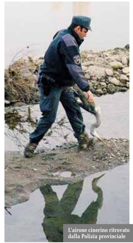
L'airone cinerino ritrovato dalla Polizia provinciale