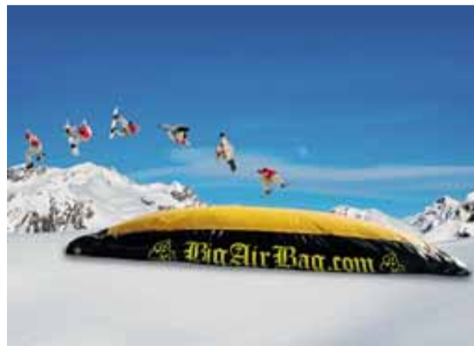
L'immagine pubblicitaria del «Big air bag» che arriverà a Lizzola

«Per gli appassionati e i turisti presenti in valle al costo di dieci