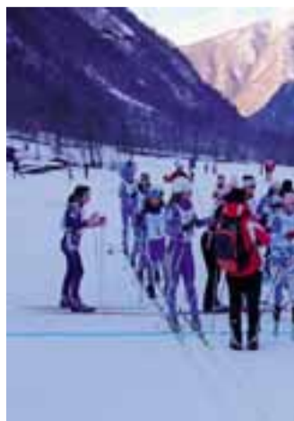
Sci di fondo a Valbondione