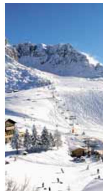
I Piani di Bobbio

Per lo sci della Valle Brembana, quindi, una realizzazione molto importante voluta dalla Itb, so-