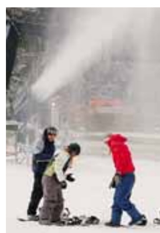
Sugli sci a Colere