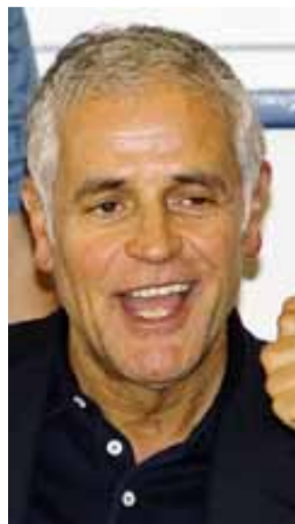
Il presidente Formigoni

«Gli Stati generali dei Parchi - spiega Formigoni - hanno l'obiettivo di coinvolgere il territorio per decidere insieme, all'insegna della sussidiarietà e del partenariato, quali saranno le scelte future per aumentare la tutela delle aree protette». La «Lombardia verde» - ha ricordato Formigoni, presentando l'iniziativa - è grande quanto il Molise o la Liguria: sono infatti 500 mila gli ettari lombardi di patrimonio naturalistico, culturale e turistico. Nella nostra regione, inoltre, il 25% del terri-