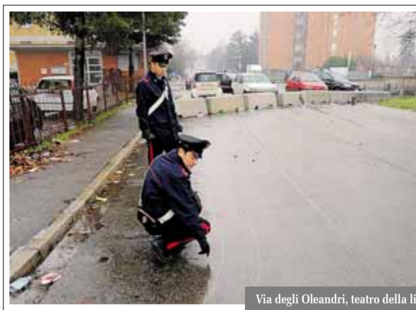
Via degli Oleandri, teatro della lite

Allora era stato avvolto in un lenzuolo (ritrovato poi accanto al cadavere) e caricato su un'auto. Dalla quale era stato scaricato sulla provinciale tra Vaprio e Canonica. E qui, ai bordi della carreggiata, che alle 6,45 era stato