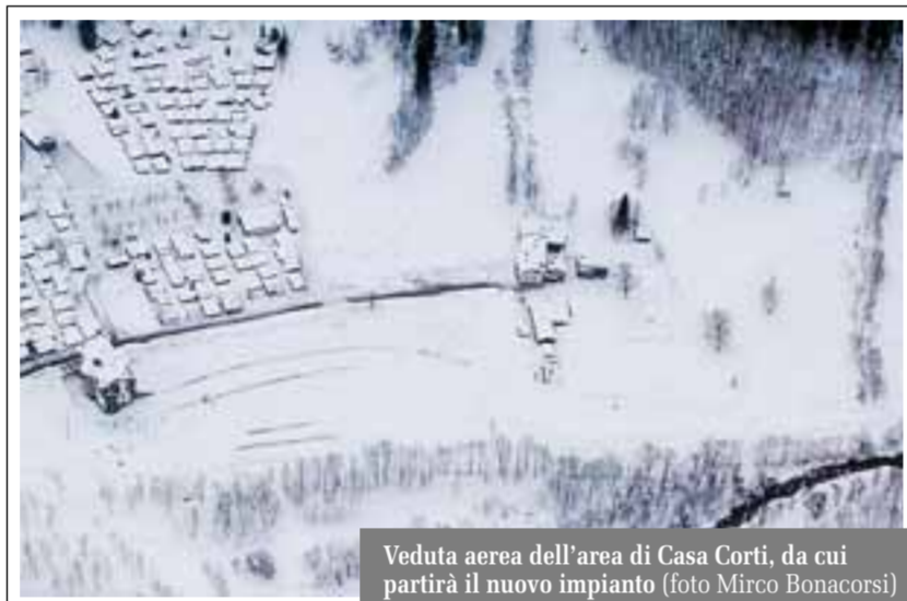
Veduta aerea dell'area di Casa Corti, da cui partirà il nuovo impianto