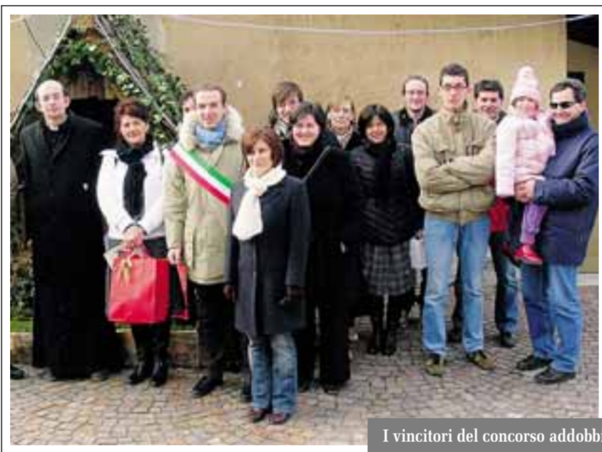
I vincitori del concorso addobbi